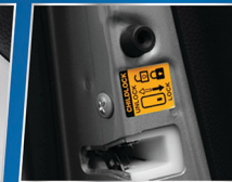
CHILD PROOF DOOR LOCK

Memberikan kemudahan untuk membuka jendela depan.