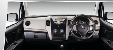
NEW COLOR GARNISH DASHBOARD

Dashboard dengan warna baru yang membuat kabin semakin nyaman dan elegan.