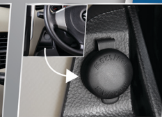
POWER OUTLET 12 V

Audio system baru yang menyatu dengan dashboard.