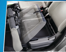
UNDER SEAT TRAY

Aliran udara dingin yang berikan kenyamanan ke seluruh kabin.