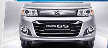
NEW FRONT GRILLE, HEADLAMPS, FOG LAMPS

Tampilan eksterior baru yang semakin meningkatkan tampilan dari Karimun Wagon R GS.