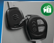
IMMOBILIZER & KEYLESS ENTRY

Bentuk sporty dengan lingkaran lebih besar untuk stabilitas yang lebih baik.