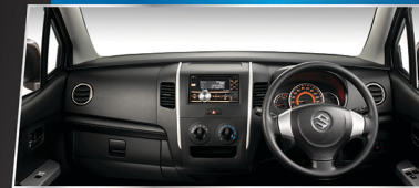
SPACIOUS CABIN WITH MODERN DASHBOARD

Sistem keamanan terkini yang meningkatkan keamanan serta kenyamanan.