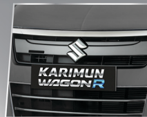
S LOGO ON THE GRILLE

Terlihat semakin elegan dengan logo S chrome.