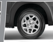
13" STAR SHAPE ALLOY WHEEL

Terlihat semakin elegan dengan logo S chrome.