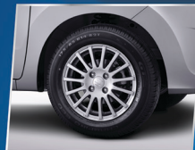
14" ALLOY WHEEL

Tampilan eksterior baru yang semakin meningkatkan tampilan dari Karimun Wagon R GS.