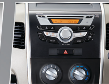
INTEGRATED AUDIO PANEL

Dashboard dengan warna baru yang membuat kabin semakin nyaman dan elegan.