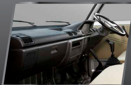
Kabin yang lega.