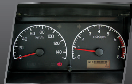
Speedometer dengan indikator bensin, tripmeter & odometer digital.