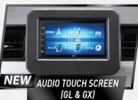
NEW AUDIO TOUCH SCREEN (GL & GX)

Mesin bensin 1.200 cc yang ringan dan efisien