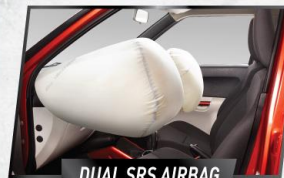
DUAL SRS AIRBAG

Melalui berbagai teknologi keamanan terkini, IGNIS berikan ketenangan serta kenyamanan saat berkendara.