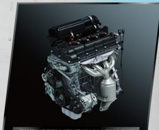
FUEL EFFICIENT K12M ENGINE

Secara otomatis mengatur temperatur suhu di dalam kabin