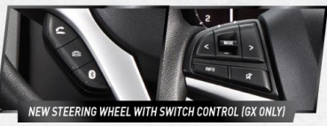
NEW STEERING WHEEL WITH SWITCH CONTROL (GX ONLY)

Mempermudah pengoperasian audio dan juga menerima/menolak telepon melalui roda kemudi.