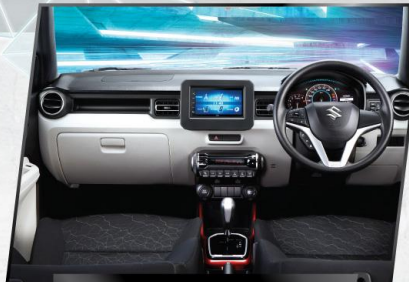
FUTURISTIC INSTRUMENT PANEL

Memasuki kabin IGNIS, kesan lapang, modern, unik, futuristik, dan nyaman langsung terasa. Ditambah lagi dengan detail-detail berkelas dan sporty.