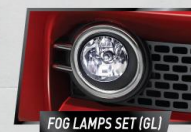
FOG LAMPS SET (GL)