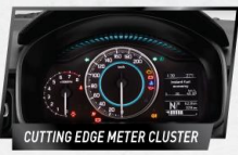
CUTTING EDGE METER CLUSTER

Audio Touch Screen dengan fitur AM/FM, MP3, USB, AUX & Bluetooth Connection