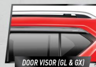
DOOR VISOR (GL & GX)