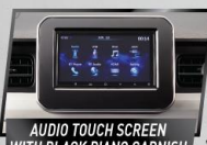
AUDIO TOUCH SCREEN WITH BLACK PIANO GARNISH