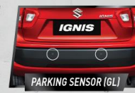
PARKING SENSOR (GL)