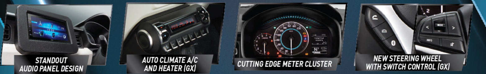
STANDOUT AUDIO PANEL DESIGN Desain head unit unik dengan fitur USB, AUX & Bluetooth Connection AUTO CLIMATE A/C AND HEATER (GX) Secara otomatis mengatur temperatur suhu di dalam kabin CUTTING EDGE METER CLUSTER Tampilan lebih atraktif & sporty KEYLESS ENTRY & PUSH START/STOP BUTTON (GX) Memudahkan dan meningkatkan faktor keamanan & kenyamanan

IGNIS sebagai sebuah generasi baru Urban SUV, berikan fitur-fitur berkelas. Mendukung mobilitas perkotaan yang dinamis baik dari sisi kenyamanan, keamanan, dan juga power.