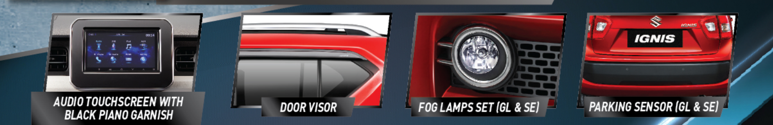
AUDIO TOUCHSCREEN WITH BLACK PIANO GARNISH | DOOR VISOR | FOG LAMPS SET (GL & SE) | PARKING SENSOR (GL & SE)