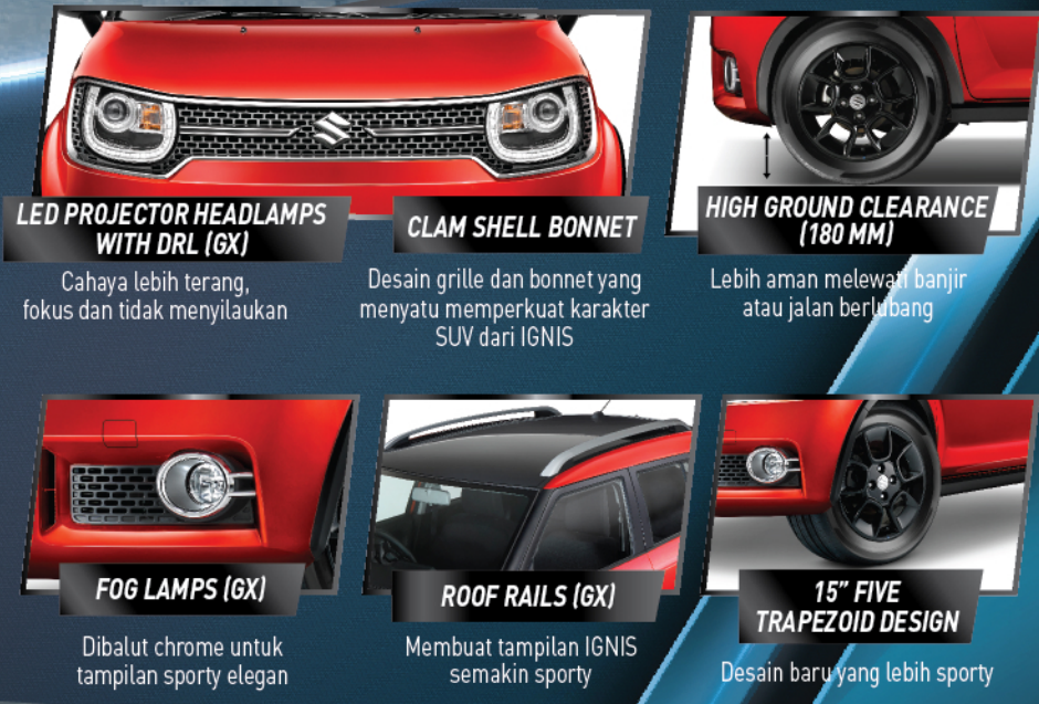
HIGH MOUNT STOP LAMP (GX) Lampu rem di bagian atas untuk visibilitas REAR COMBINATION LAMPS Lampu belakang unik namun tetap fungsional 4 POINT PARKING SENSORS (GX) Sensor parkir berikan kenyamanan dan keamanan LED PROJECTOR HEADLAMPS WITH DRL (GX) Cahaya lebih terang, fokus dan tidak menyilaukan CLAM SHELL BONNET Desain grille dan bonnet yang menyatu memperkuat karakter SUV dari IGNIS HIGH GROUND CLEARANCE (180 MM) Lebih aman melewati banjir atau jalan berlubang FOG LAMPS (GX) Dibalut chrome untuk tampilan sporty elegan ROOF RAILS (GX) Membuat tampilan IGNIS semakin sporty 15" FIVE TRAPEZOID DESIGN Desain baru yang lebih sporty