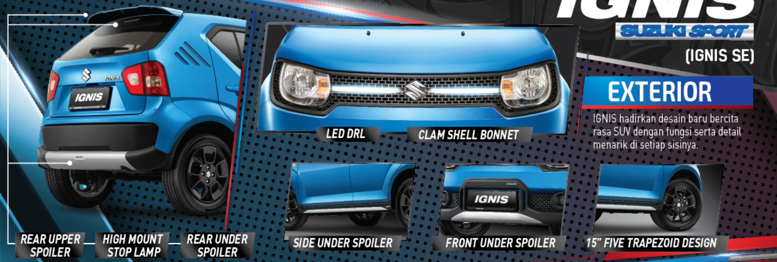
REAR UPPER SPOILER | HIGH MOUNT STOP LAMP | REAR UNDER SPOILER | LED DRL | CLAM SHELL BONNET | SIDE UNDER SPOILER | FRONT UNDER SPOILER | 15" FIVE TRAPEZOID DESIGN

IGNIS hadirkan desain baru bercita rasa SUV dengan fungsi serta detail menarik di setiap sisinya.