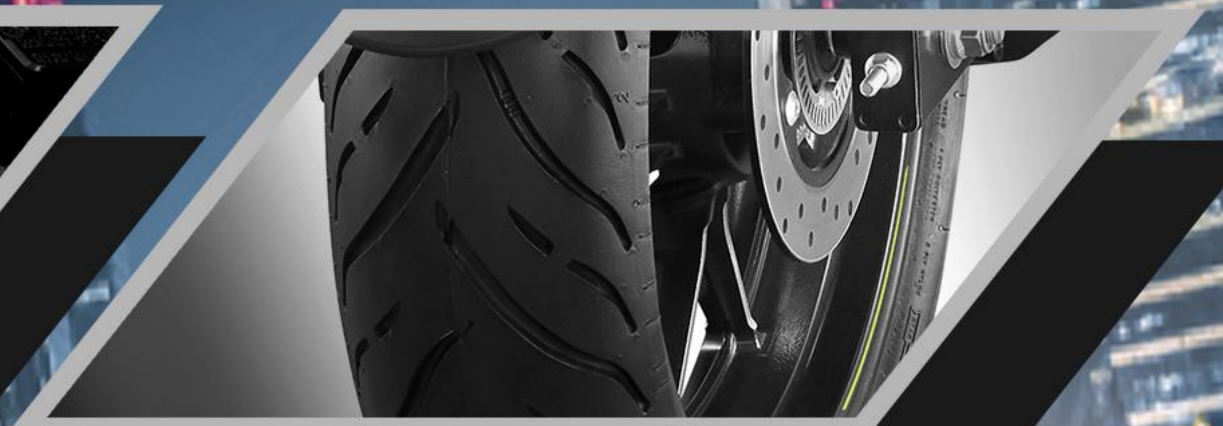
RADIAL WIDE TYRE