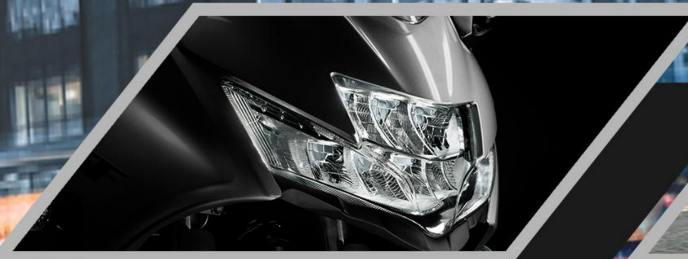
LED HEAD LIGHT