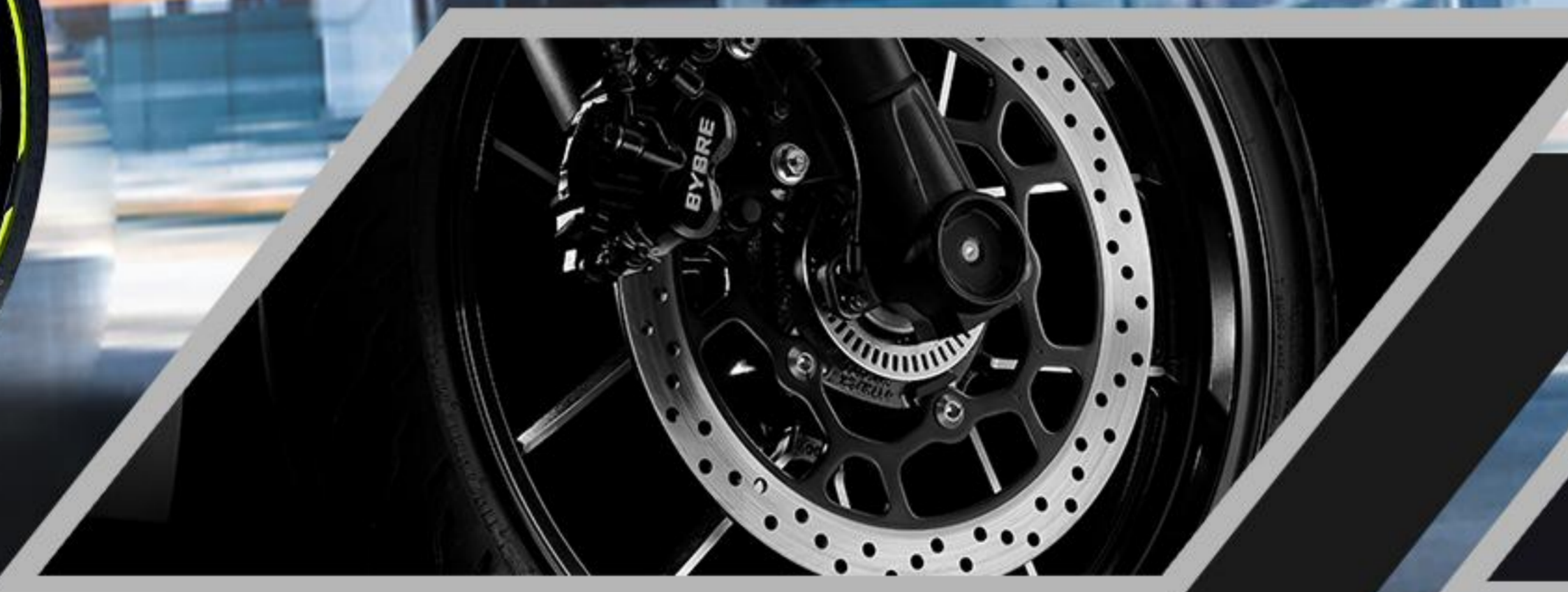
BIG DISC BRAKE 300mm