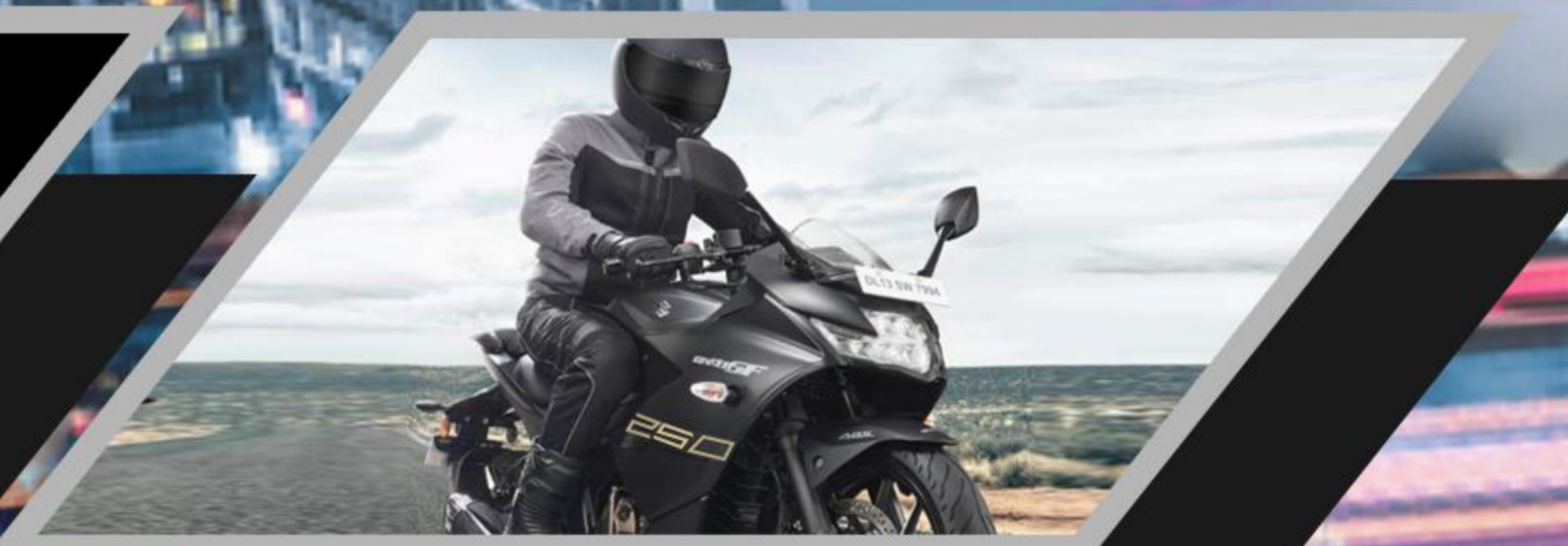
COMFORT RIDING POSITION