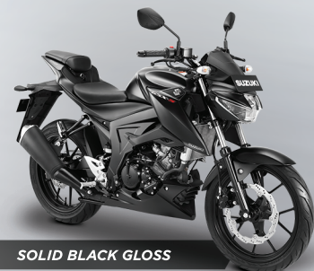
SOLID BLACK GLOSS