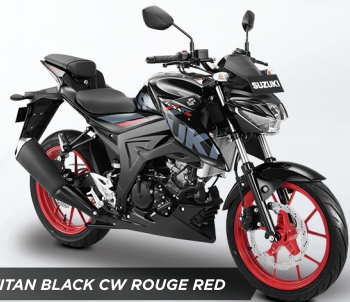
TITAN BLACK CW ROUGE RED