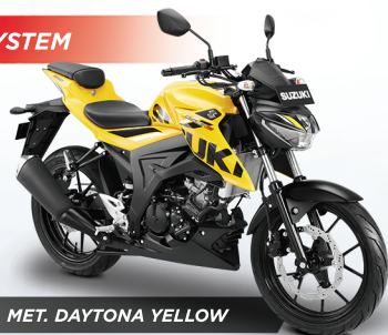
MET. DAYTONA YELLOW