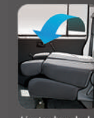
Lipatan bangku ke 1