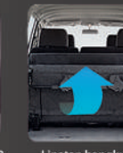
Lipatan bangku ke 3