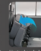
Lipatan bangku ke 2