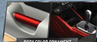
BODY COLOR ORNAMENT

Panel instrumen ergonomis yang mudah dijangkau