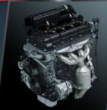
FUEL EFFICIENT K12M ENGINE

IGNIS sebagai sebuah generasi baru Urban SUV, berikan fitur-fitur berkelas. Mendukung mobilitas perkotaan yang dinamis baik dari sisi kenyamanan, keamanan, dan juga power.