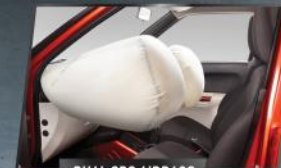
DUAL SRS AIRBAGS

Memberikan perlindungan dari benturan depan