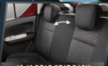
60:40 REAR SEAT BACK

Berikan kenyamanan untuk penumpang belakang