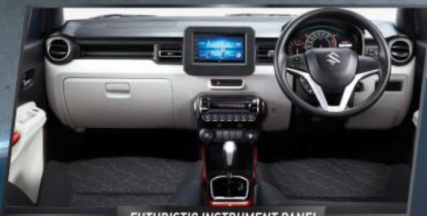
FUTURISTIC INSTRUMENT PANEL

Memasuki kabin IGNIS, kesan lapang, modern, unik, futuristik, dan nyaman langsung terasa. Ditambah lagi dengan detail-detail berkelas dan sporty.