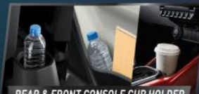
REAR & FRONT CONSOLE CUP HOLDER

Ruang penyimpanan yang berikan kemudahan serta kenyamanan