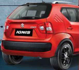
HIGH MOUNT STOP LAMP (GX)

IGNIS hadirkan desain baru bercita rasa SUV yang sporty dan stylish. Membuatnya tampil menonjol di antara para pesaingnya.