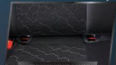
STYLISH SEAT COVER

Detail warna di dalam kabin sama dengan warna body