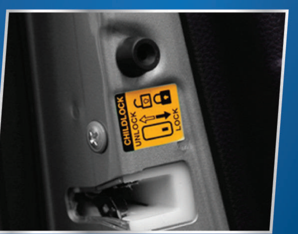
CHILD PROOF DOOR LOCK

Memberikan kemudahan untuk membuka jendela depan.